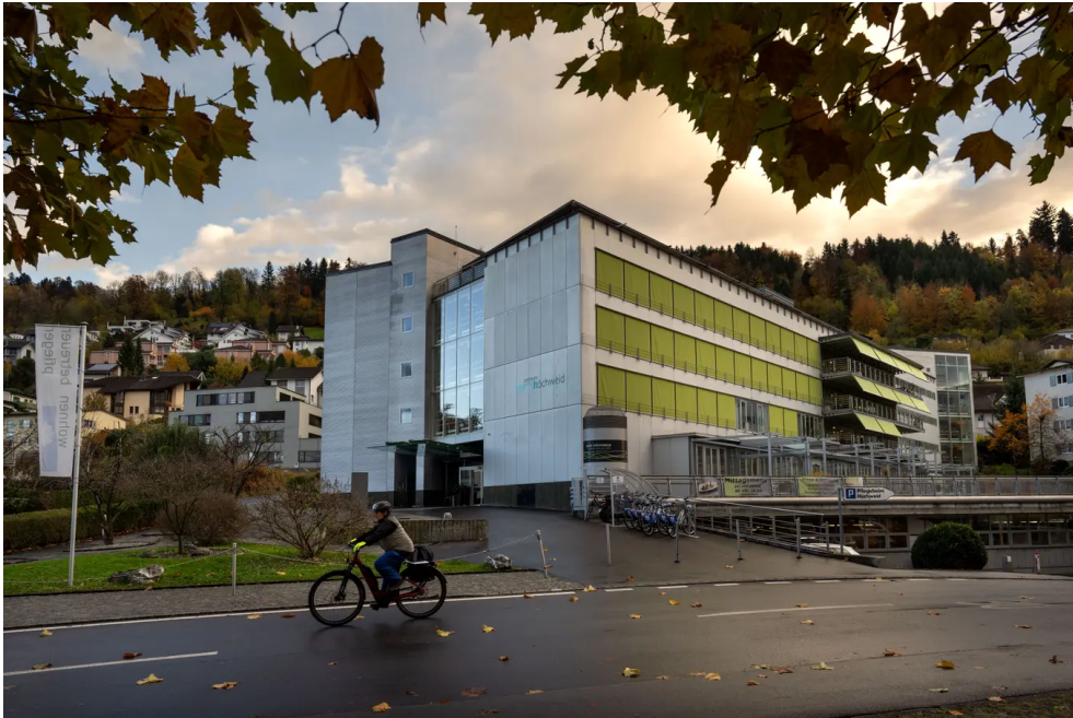
Das Zentrum Höchweid in Ebikon.

Bild: Eveline Beerkircher (16. 11. 2023)